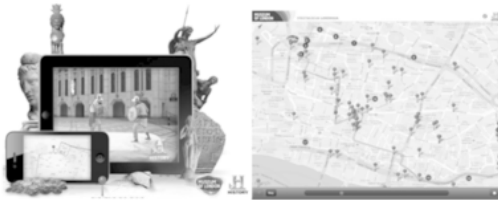
Abb. 2: App Streetmuseum: Londinium

vorhandene Situation bezogen wird. Das Museum of London hat 2011 die kostenlose App Streetmuseum: Londinium angeboten, die die Museumsbesucherinnen bzw. -besucher während ihrer Stadterkundungen nutzen konnten, um sich über die römische Geschichte der Stadt zu informieren. Dank der App haben sie erfahren, wie der alte römische Stadtplan ausgesehen hat und konnten geschichtsträchtige Orte finden, ihre Geräte auf die aktuellen Hausfassaden ausrichten und passende digitale Daten abrufen (Allsop 2011). Im Gegensatz zu AR meint die virtuelle Realität (Virtual Reality/VR) eine Erfahrungssituation, die keine direkte Verbindung zu Realität festlegt. Hier wird eine 3D-Umgebung vollständig digital entworfen und die Agierenden in ihr eingeschlossen.