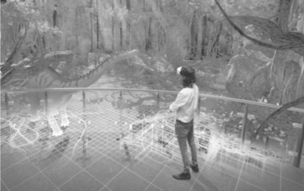
Abb. 3: Der Sauriersaal des Senckenberg Naturmuseums, wie ihn die Besucherinnen und Besucher kennen