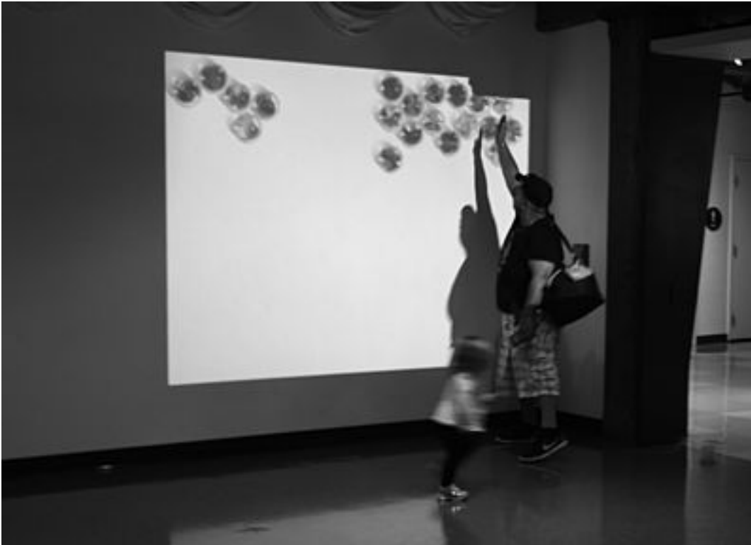
Abb. 4: Spielstation des Children's Museum in Boston

Ebenfalls erscheint die Beschreibung für die neuesten Entwicklungen im Spiel Minecraft Earth (WWDC 2019) mit den Begriffen Immersion, Komplexität der Erzählung, Interaktion oder Multimedialität zielführend. Mit komplexen technischen Anwendungen für Smartphones – in denen Erfassung von Ganzkörperbewegungen, fotorealistische Live-Abbildungen, Gesichtserkennung und virtuelle Realitäten zum Einsatz kommen – ist es möglich, sich in Echtzeit in virtueller/realistischer Welt zu bewegen. Eine virtuelle, digitale Spielumgebung von Minecraft Earth kann in Lebensgröße in einen Raum projiziert werden in dem zugleich die Kamera von iPads oder Smartphones die Bewegungen von Spielerinnen und Spieler erfasst und sie in diese digitale Spielumgebung hineinprojiziert (mixed.de).