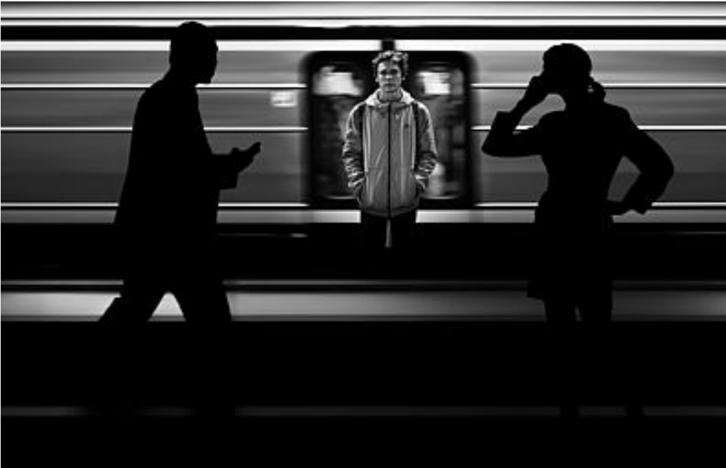
Abb. 1: Mangels Zugang zu Smartphone und Co. erleben Menschen mit Behinderung in stationären Einrichtungen häufiger Ausgrenzung