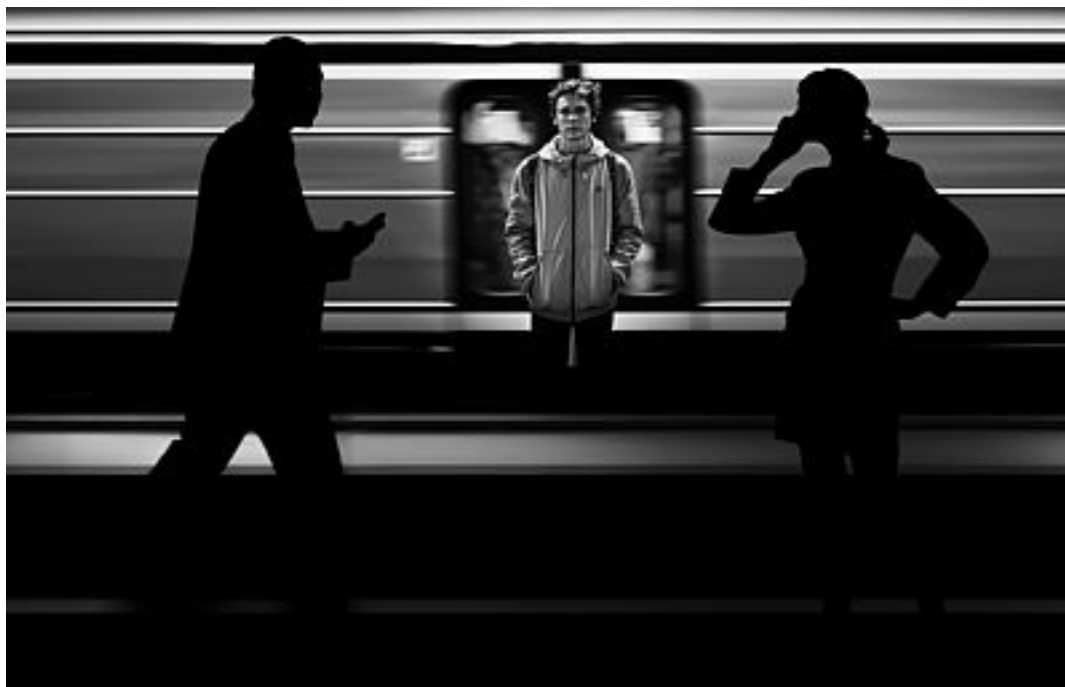
Abb. 1: Mangels Zugang zu Smartphone und Co. erleben Menschen mit Behinderung in stationären Einrichtungen häufiger Ausgrenzung