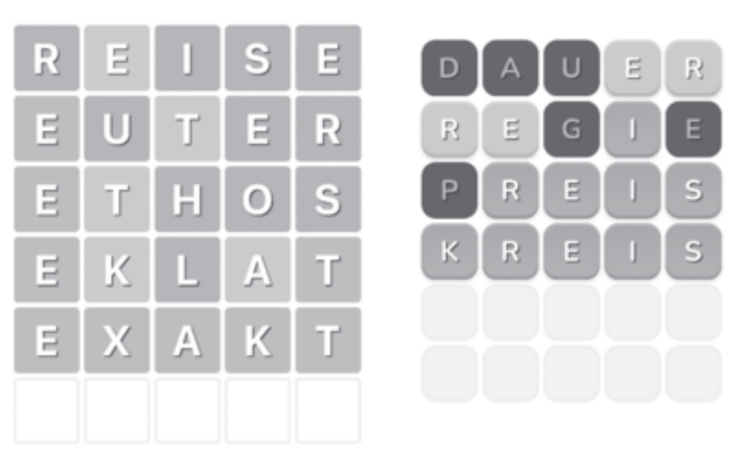
Abbildung 1: 6mal5 und Voortle

Hinzu gesellen sich anspruchsvollere Varianten mit zwei, vier oder acht parallel zu ermittelnden Buchstabensets (Dordle, Quordle, Octordle). Auch themenspezifische Wordle-Ausprägungen etwa für Fans von Disney, Harry Potter und Star Wars bereichern das Angebot.